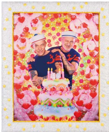
↑ Pierre et Gilles, 40 ans – Autoportrait , 2016. Photographie imprimée par jet d'encre sur toile et peinte, 123,5 x 102 cm. Pièce unique.