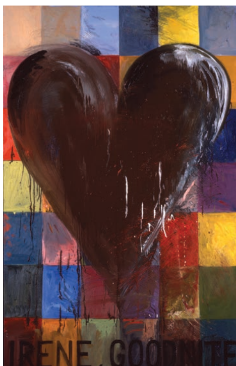
↑ Jim Dine, Irene... , 1993. Huile et émail sur toile, 213,4 x 137,2 cm.

VERNISSAGE PRESSE : JEUDI 13 FÉVRIER 2020, 9H30 – 13H