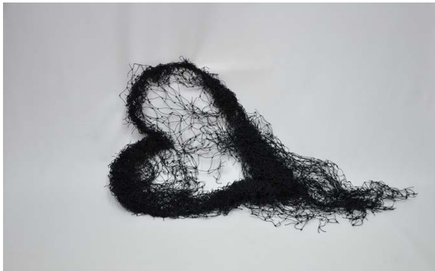
↑ Annette Messenger, Cœur au repos , 2009, fil de fer, filet noir, 43 x 100 x 17 cm, Collection Antoine de Galbert, Paris

Musée de la Vie romantique Catherine SOREL presse.museevieromantique@paris.fr 01 71 19 24 06